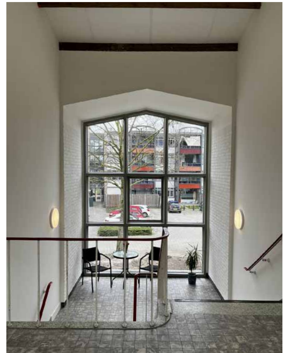
Het eerste Zorgbuurthuis in Oss