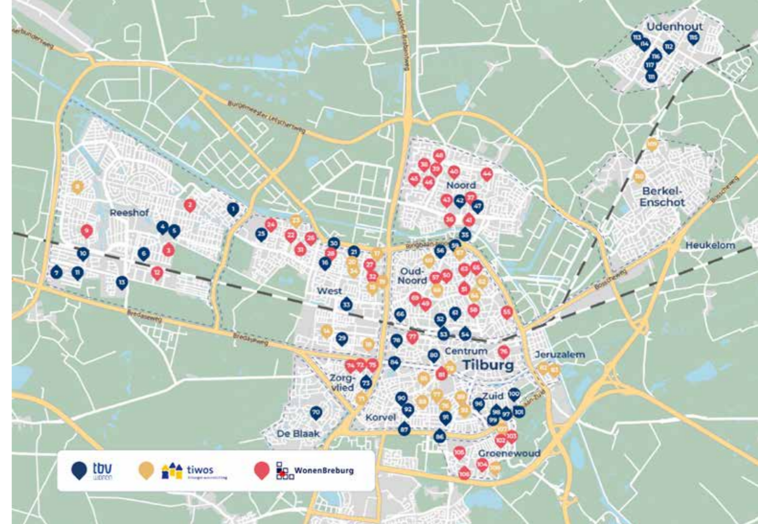
Seniorencplexen Tilburg Woningen van Tiwos, TBV Wonen en WonenBregburg