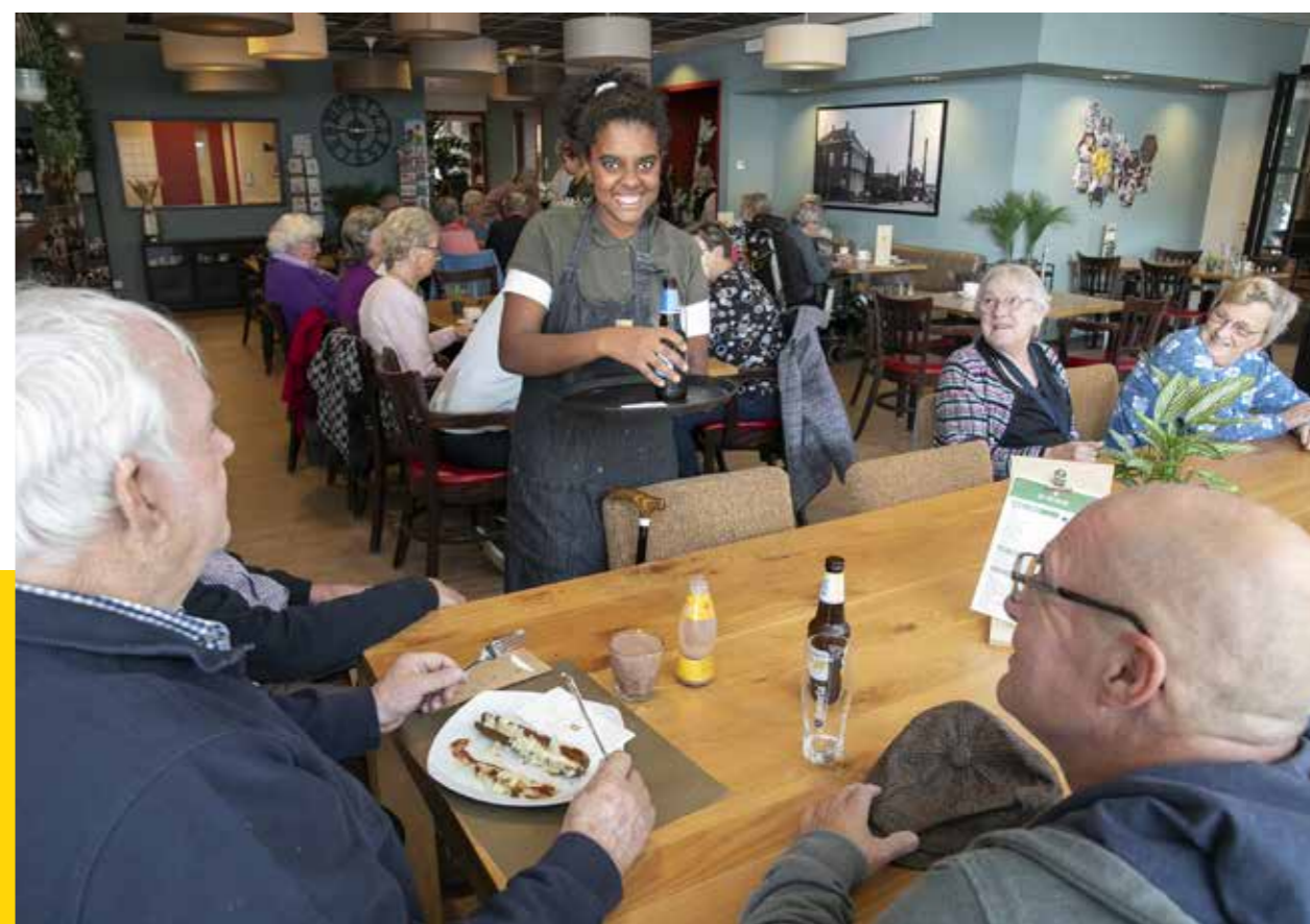
Jong en oud vindt elkaar bij 'kWil't in het voormalige St Jozefzorg in Fatima in Tilburg

Het is misschien niet in strikte zin een Zorgbuurthuis zoals dat in het initiatiefvoorstel van de SP staat, maar het komt er wel heel dichtbij in de buurt: 'kWil't of Quilt. Een nieuw woongebied waar (kwetsbare) ouderen zelfstandig wonen met jongeren met een beperking. In de wijk Fatima is het voormalige St Jozefzorg omgevormd tot een woonomgeving met 82 units waarvan 9 voor jongeren van Prins Heerlijk. Samenredzaamheid is er de norm. Iedereen levert daar een bijdrage aan; op een eigen niveau naar eigen mogelijkheden. 'kWil't bestaat vrijwel volledig uit sociale huurwoningen met minder financiële draagkrachtige bewoners. Centraal in het gebied is een woonzorgcentrum van De Wever (Satijnhof) gevestigd. Daaromheen is nieuwbouw gepleegd en zijn oude zorgpanden gerenoveerd tot complexen met zelfstandige appartementen. 'kWil't biedt voor al deze bewoners ondersteuning. Een deel van de bewoners is prima in staat om medebewoners van dienst te zijn, terwijl anderen juist aangewezen zijn op anderen om zelfstandig en plezierig te kunnen leven. In het nieuwe ontstane buurtje zien Prins Heerlijk, de Wever en TBV kans om diverse sociale programma's met elkaar te combineren.